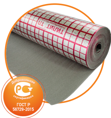
Рулоны ТИЛИТ® Супер ТП