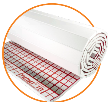
Плиты и маты ТИЛИТ® ТП